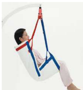
移動用リフト交換可能部分