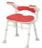
IS フィット 骨盤サポート