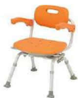
シャワーベンチ「ユリア」ミドル SP回転折りたたみN